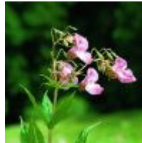
Drüsiges Springkraut ( Impatiens glandulifera )