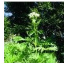
Riesenbärenklau ( Heracleum mantegazzianum )