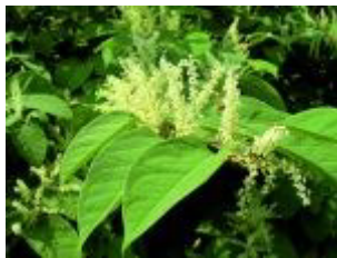
Asiatische Staudenknöteriche ( Reynoutria und Polygonum )