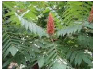
Essigbaum ( Rhus typhina )