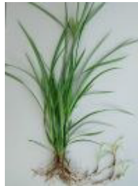
Erdmandelgras ( Essbares Zypergras ) ( Cyperus esculentus )