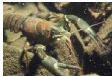
Signalkrebs ( Pacifastacus leniusculus )