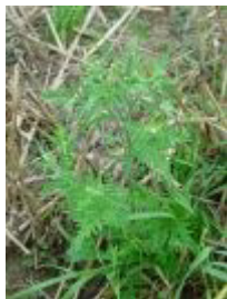
Aufrechte Ambrosia ( Ambrosia artemisiifolia )