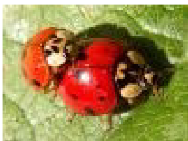
Asiatischer Marienkäfer ( Harmonia axyridis )